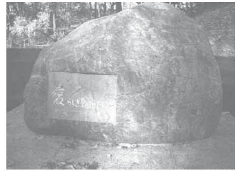
▲【東京薬科大学実験動物慰霊碑】

愛らしき動物たちに、東京薬科大学実験動物慰霊碑(以下、動物慰霊碑)は以前、コミュニケーション・プラザの一角に ありましたが、現在建設中である学生会館の工事を始めるにあたり、全天候コート近くの現在