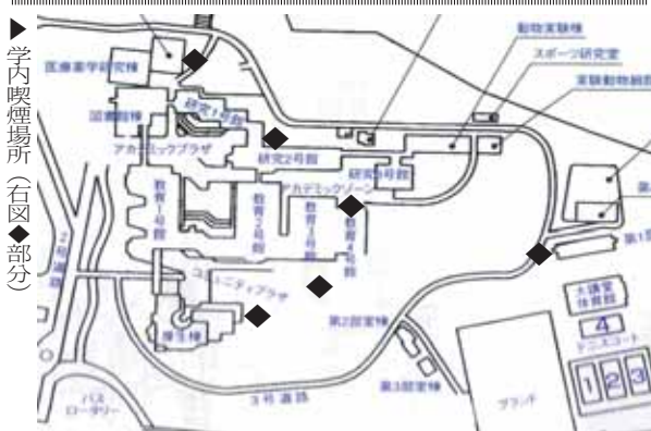
▶学内喫煙場所(右図◆部分)

が、世間の風潮の影響や喫煙者の減少に伴い撤去されてしまいました。それでも喫煙したい人のために学内には六つの喫煙所が設置されています。しかし、最近学