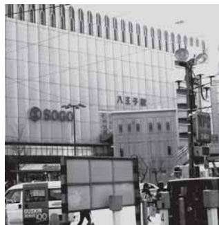
▲ J R 八王子駅の外観