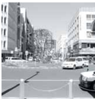
▲豊田駅北口タクシールール