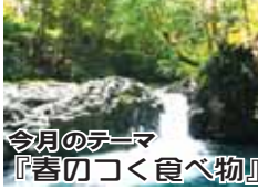
今月のテーマ 『春のつく食べ物』