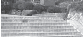
▲僕たちは長く険しい階段を昇り始めたばかり (陰陽師)

ど条件付きで「当該学期の三分の二以上が本試験で不合格だと再試験を受けられない」というルールがあります。極端な例ですが、試験の全科目が十二科目だとすると九科目(つまりおおよそ九単位)本試験で落とされた時点で再試験の受験資格を失います。ちなみに本大学は再履修科目(次年度に持ち越される科目、つまり落とした単位)が五単位以内でないとは進級できません。前期で留年にならないよう日頃の勉強を疎か