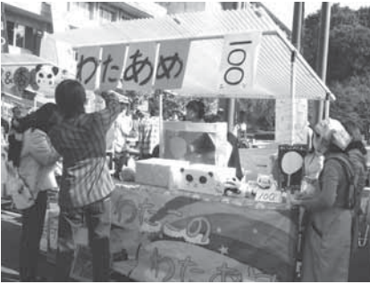
▲ <11月> 3日間にわたる東薬祭の様子

二面 大学周辺街紹介・ロケスポット 三面 大学生活のススメ・学内喫煙事情・捕鯨問題