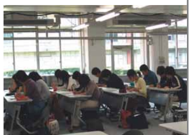
▲薬物動態制御学研究室の4年生の皆さん

「CBT対策や国家試験対策を中心に利用するつもりですが、後は学年に関わらず学習や授業に利用できるように検討しています。」