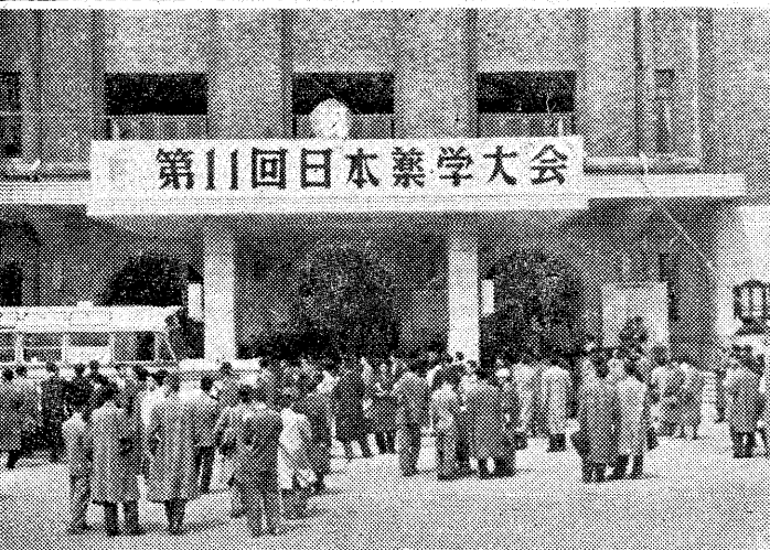
第11回日本薬学大会

寺正先生は、新入生に対して、本学の教育理念と特別実習制度の重要性を説明している。特別実習制度は、学生が専門分野の知識と技術を身につけるための重要な機会となる。特別実習制度は、学生が専門分野の知識と技術を身につけるための重要な機会となる。